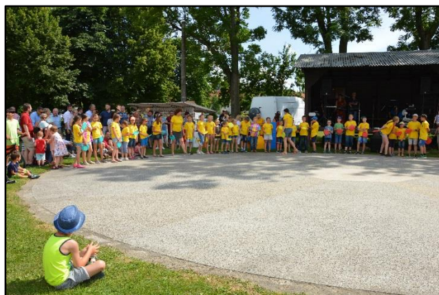
Školáci se chystají na svůj výstup