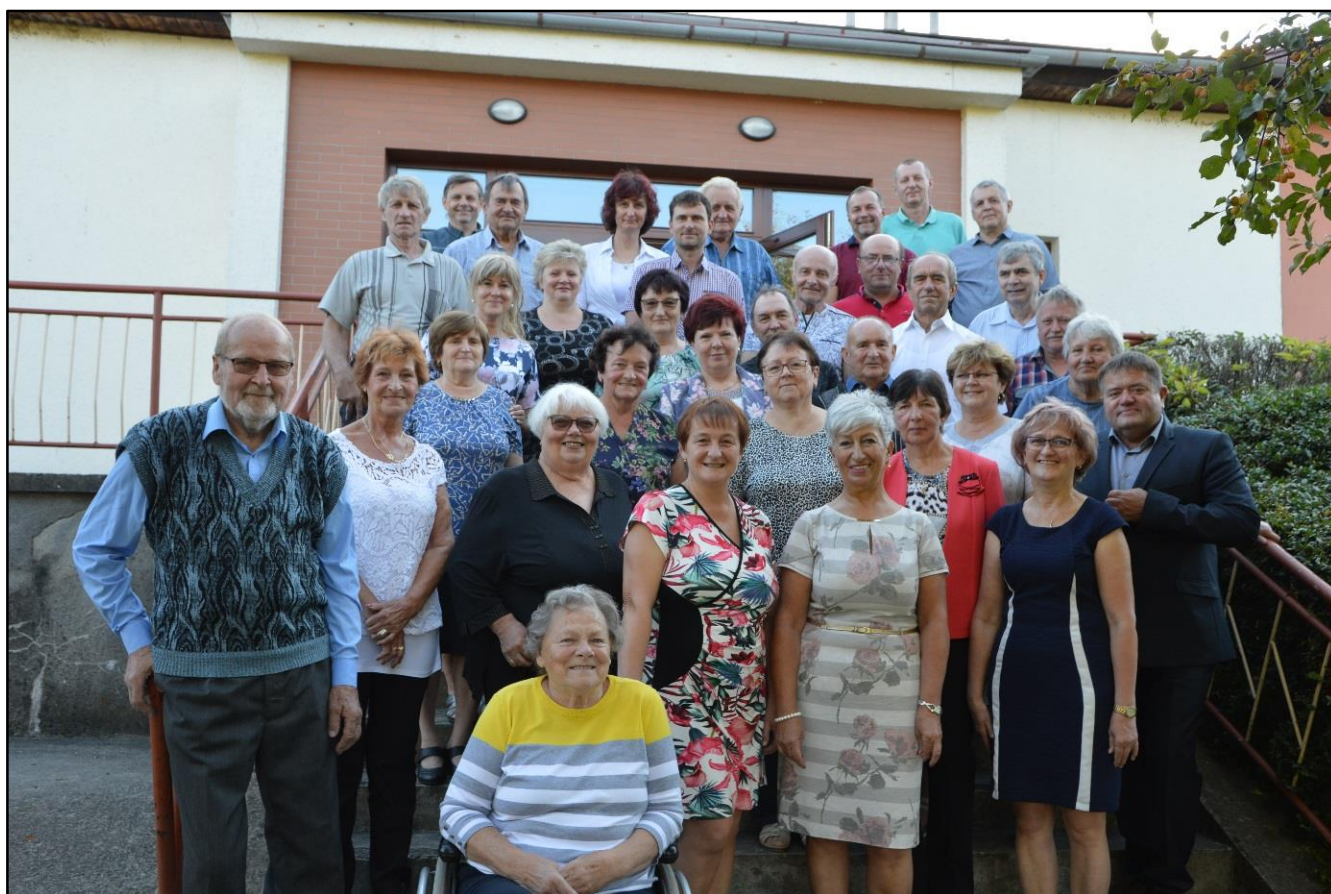
Ve čtvrtek 9. září se konalo setkání jubilantů společně se zastupiteli a členy kulturní komise.