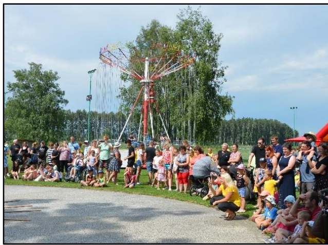
Bez kolotoče a cukrové vaty by nebyla pouť, tak za rok zas 😊

Prázdniny jako obvykle utekly jako voda, dětem i rodičům nezbylo nic jiného než se s nimi pořádně rozloučit v sobotu 28. srpna 2021.