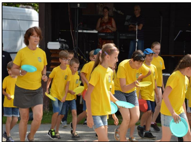
Do tance se daly i obě ředitelky