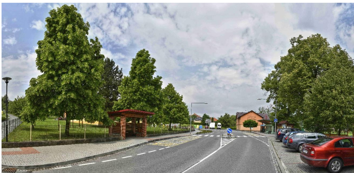
Oprava komunikace II/439 – průtah – hranice okresu Vsetín (2015) zahrnovala přechod pro chodce, ostrůvek, osvětlení, úpravu autobusových zastávek a tři parkovací stání. Tato akce odstartovala opravu téměř všech komunikací v obci.