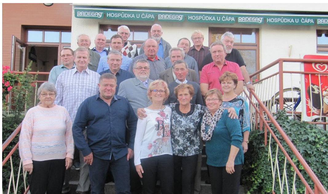
Ze setkání jubilantů - 27. 9. 2018