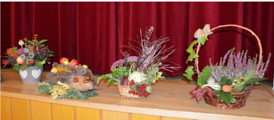
Čaj o páté 29. září - Podzimní dekorace

Čtvrtek 3. listopadu Pleteme z pedigu Čtvrtek 24. listopadu Adventní věnce Úterý 29. listopadu Pečení a zdobení perníků