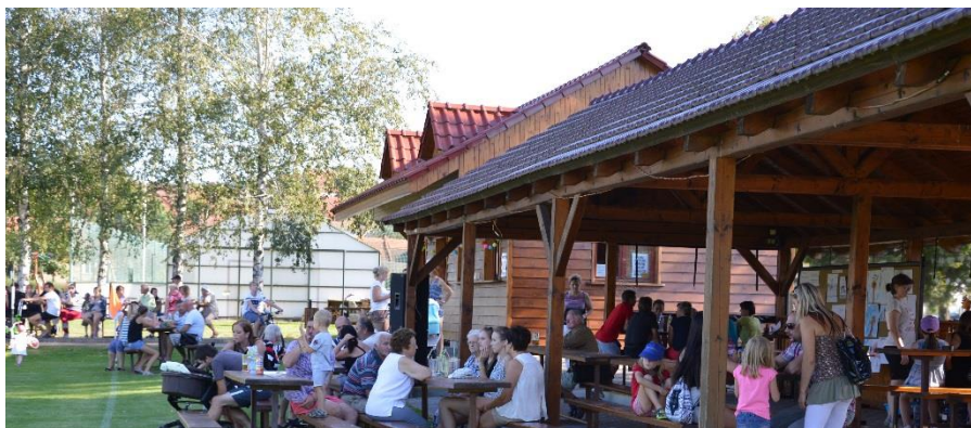
Rozloučení s prázdninami