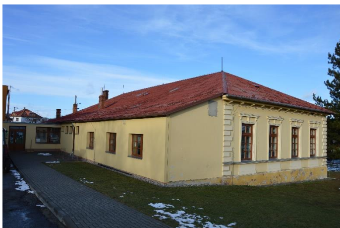
Dvorní trakt 2019