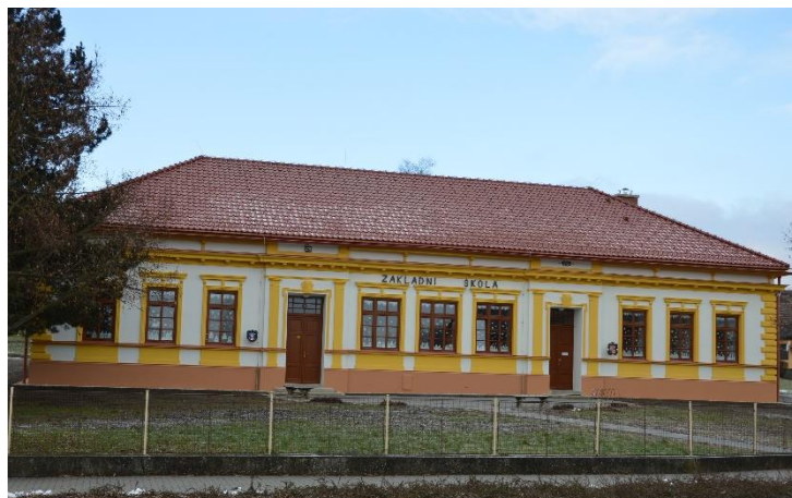
Budova základní školy 2021