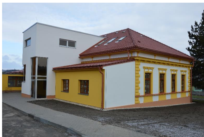
Dvorní trakt s bezbariérovým schodištěm 2021