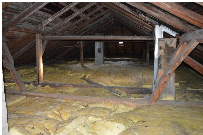
Stará půda jaro 2020