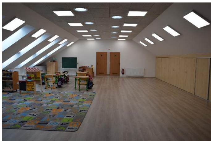
Nová učebna, sociální zázemí leden 2021