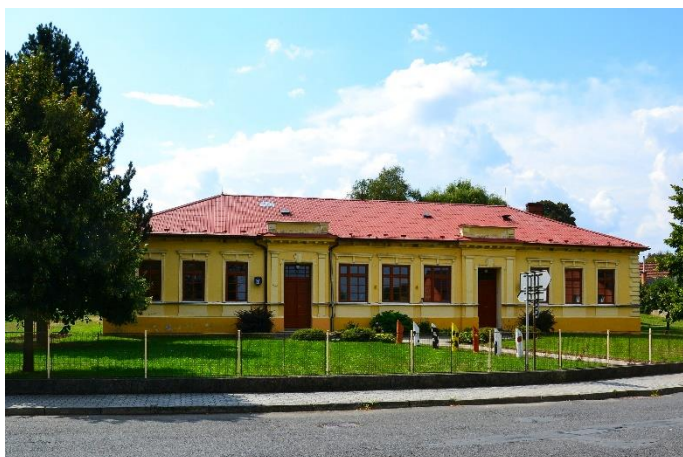
Budova základní školy po rekonstrukci 2013