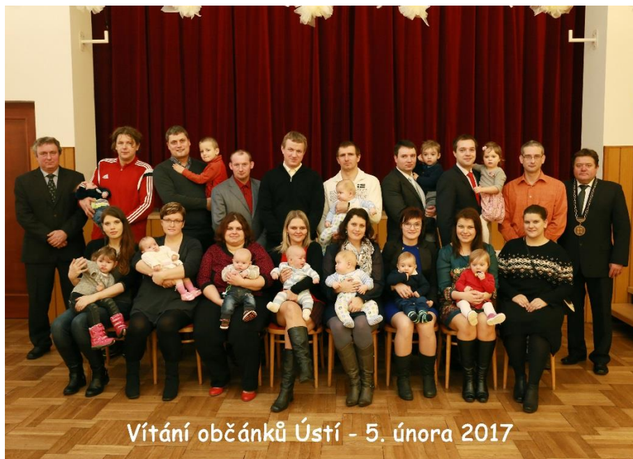
Vítání občánek Ústí - 5. února 2017