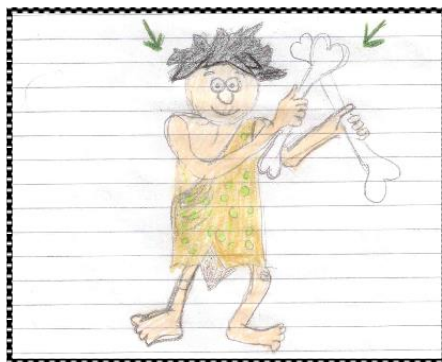
ilustrace Marie Žeravíkové, 5. ročník